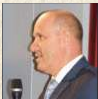
Branko Bačić, zastupnik Hrvatskog sabora i predsjednik Kluba zastupnika Hrvatske demokratske zajednice